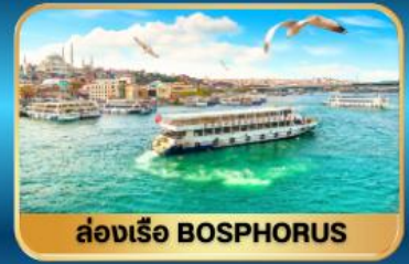
ล่องเรือ BOSPHORUS